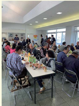
中野・湯沢、両エリアのガルテナーさん。 ご家族も一緒に一堂に会しました。 話も弾みます♪