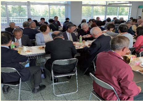
市議会議員様や市役所関係者様にも 多数ご出席頂きました。