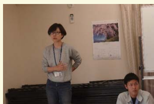
JAこま野南湖支所 横内支所長が来て下さいました