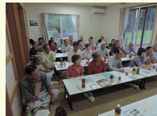
テーブルに座りきれないほどの大盛況ぶり！